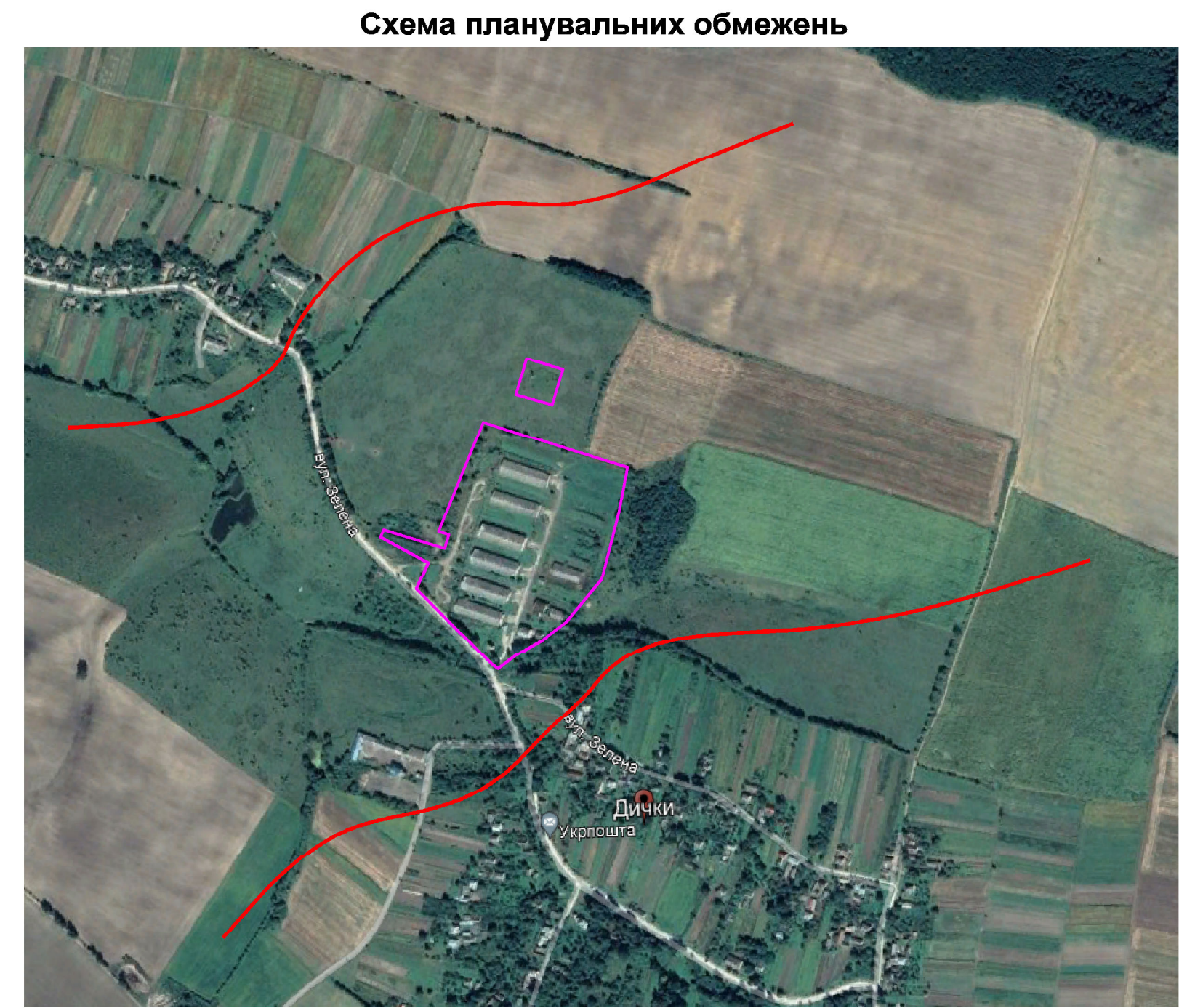
Схема планувальних обмежень